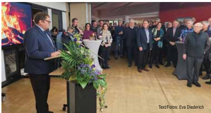
Text/Fotos: Eva Diederich

Der Wind zog im Laufe der Nacht übrigens schnell ab. Die Gäste im Rathaus konnten und durften so lange bleiben wie sie wollten.