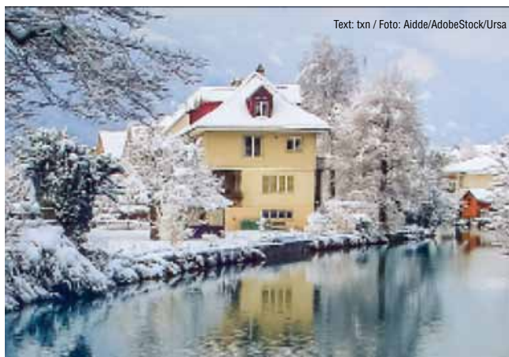
Text: txn

Wer auf besseren Wärmeschutz setzt, entlastet damit nicht nur dauerhaft den Geldbeutel und das Klima, sondern steigert auch den Wert der Immobilie. Zudem gibt es für Dämmmaßnahmen umfangreiche Förderprogramme. Weitere Informationen online unter www.ursa.de .