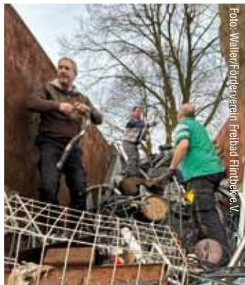
Für die Betreuung der Schrottcontainer braucht es viele helfende Hände.

Die Sammelcontainer stehen ab dem 28. März an folgenden Standorten bereit: Wendehammer Ragniter Weg, Kleingartengelände Poggendiek (Ecke Bäckerberg / Heimstättenweg) und Schoolredder in Kleinflintbek.