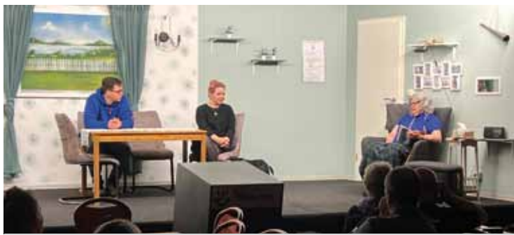
Schnappschuss zur Generalprobe