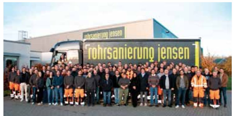
Das Team der Rohrsanieerung Jensen GmbH & Co. KG